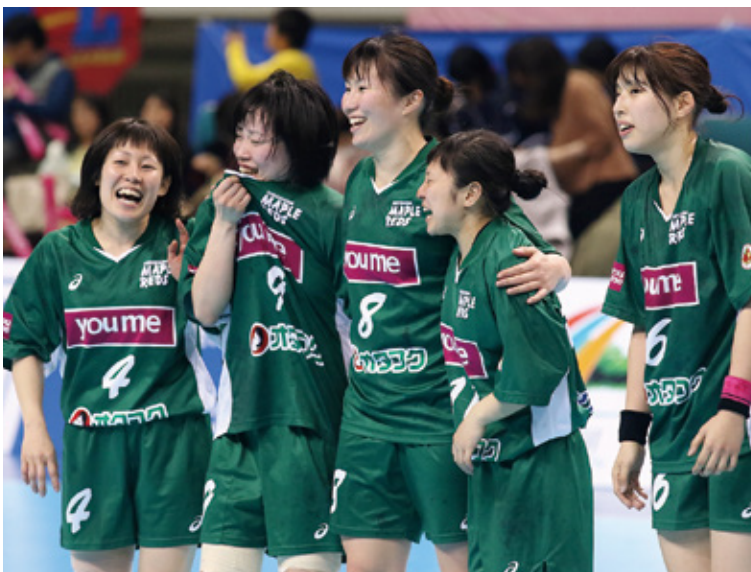
決勝進出に歓喜する広島メイプルレッズ