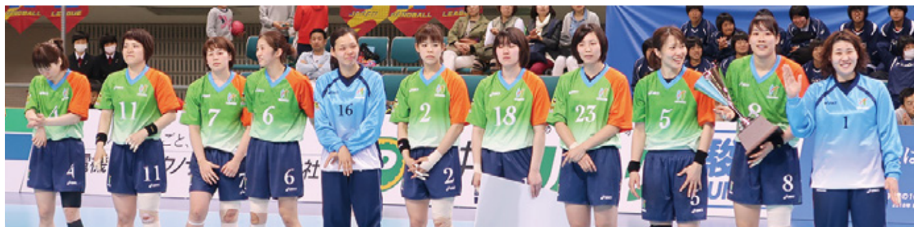
3連覇を達成した北國銀行